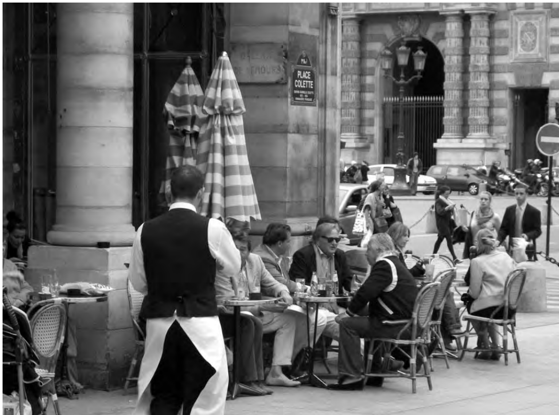
... jako místo odpočinku – Paříž ... as a place for relaxation – Paris

Hannah Arendtová představuje pohled filozofický, častěji je ovšem téma veřejného prostoru zastoupeno v pracích sociologů. Klasická (ale dnes možná již neprávem opomenutá) kniha Hanse Paula Bahrdta Moderní velkoměsto 17/ definuje polaritou veřejné a soukromé sféry samu podstatu města, městského života. V historickém