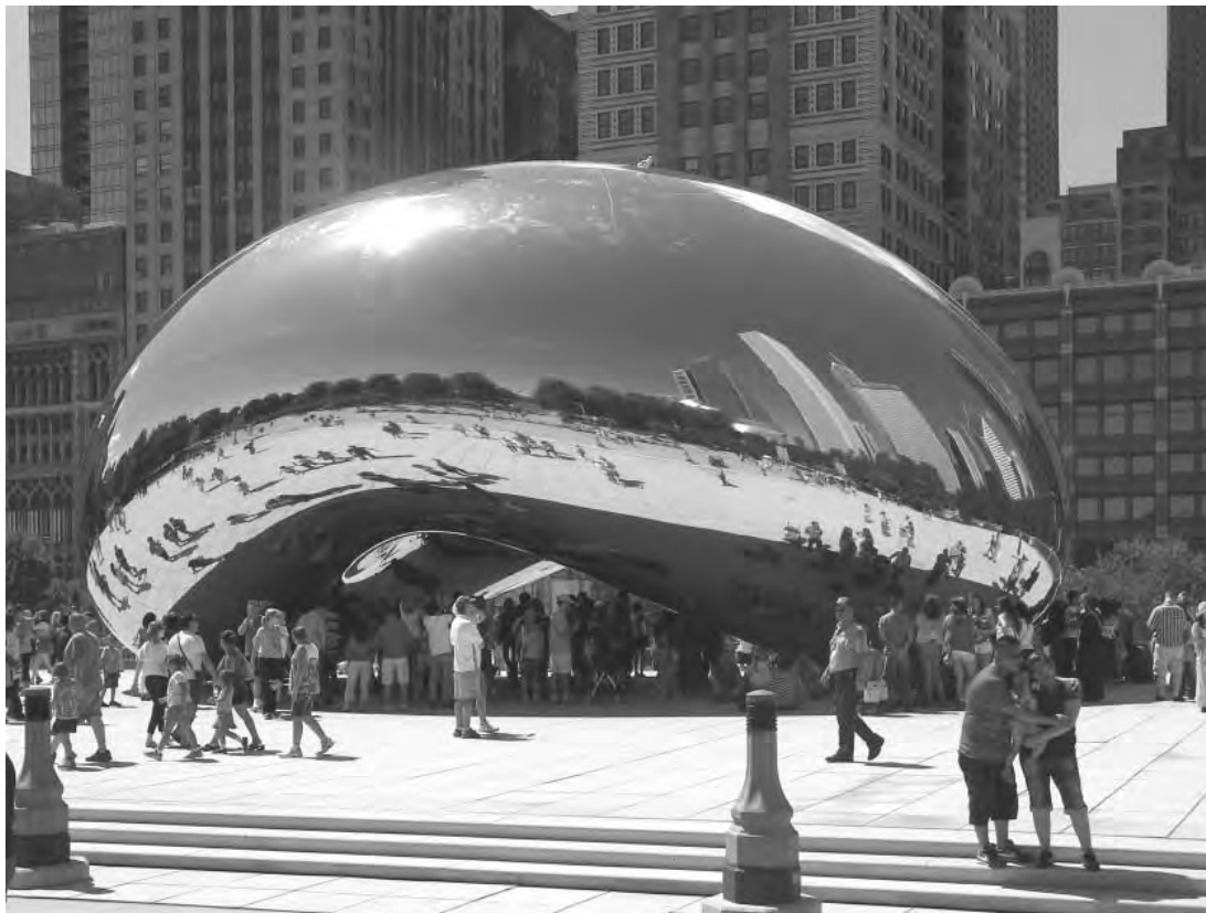
Millenium Park v Chicagu. Anish Kapoor: Vstupní brána

vy s ostatními funkcemi jsme uváděli jako dominantní. Namísto adorace motorizovaného pohybu (který sdílela avantgarda) přichází zhruba v šedesátých letech vystřízlivění a snahy o dopravní zklidnění. Ke klasickým teoretickým pracím patřila kniha Bernarda Rudofskyho Streets for People /17/ . (Je rovněž zajímavé, že vznik první pěší zóny ve Vídni na Kärtner Strasse inicioval právě zmiňovaný Victor Gruen.) Mezi dnes nejnámější obhájce vytlačení automobilové dopravy ve prospěch pěšího a cyklistického pohybu patří dánský architekt Jan Gehl /18/ . Gehlovi jde ovšem zároveň o širší urbanistické koncepce – ve zklidnění dopravy vidí podmínku renesance veřejných prostorů a v nich zas podmínku úspěšných měst. Je si vědom toho, že veřejné prostory v současnosti už neužíváme