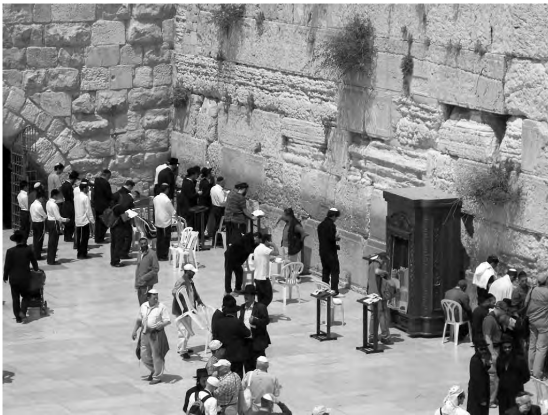
Veřejný prostor jako místo modlitby – Jeruzalém

Public space as a place for prayer – Jerusalem