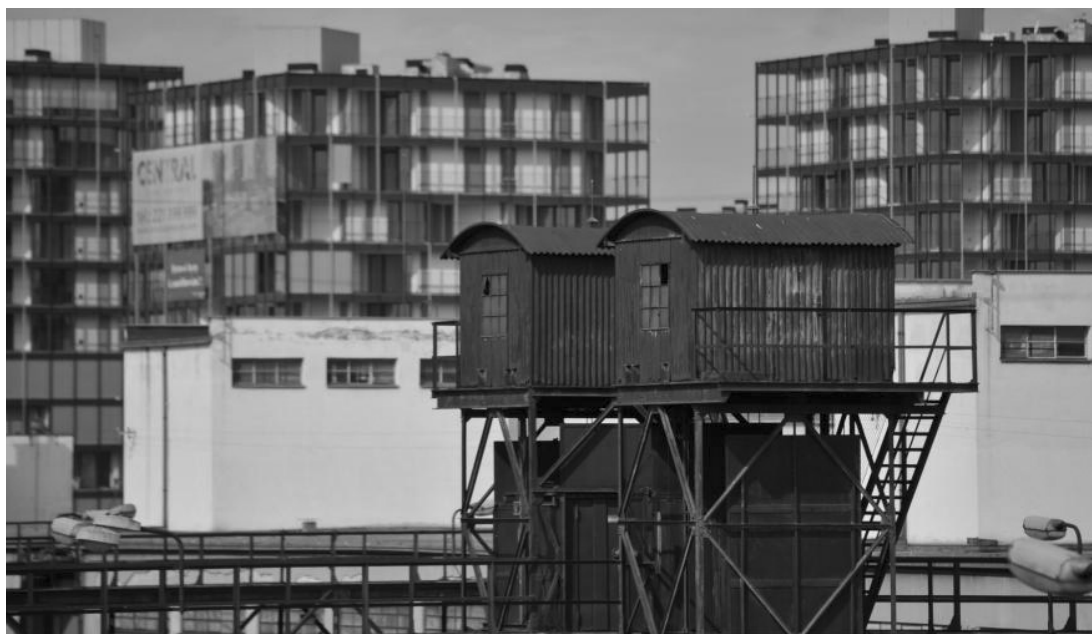
Nákladové nádraží Žižkov – symbol střetu radnice, developera a občanských iniciativ The Prague-Žižkov Cargo Rail Station – a symbol of the conflict between politicians, developers and civic initiatives