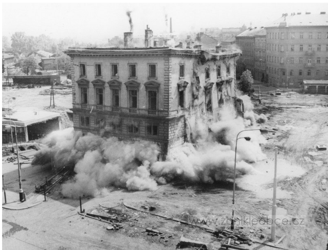
Demolice severního traktu budovy nádraží Praha – Těšnov, zleva již prostor zaplňuje těleso magistrály Demolition of the north building of the Prague – Těšnov rail station, to the left is the new motorway under construction