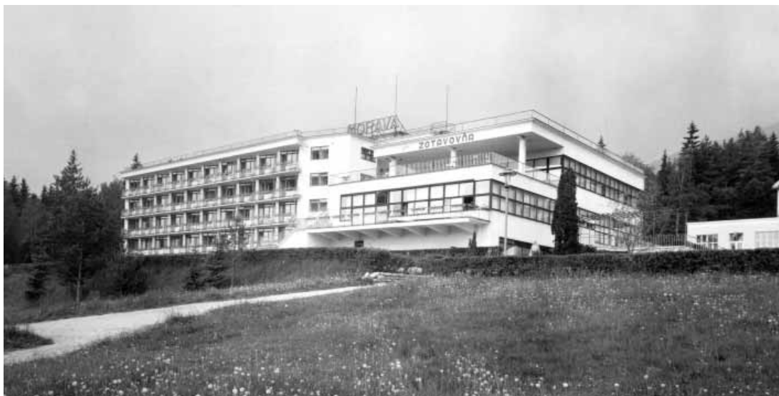
Zotavovňa Morava, pohľad na objekt od spoločenského krídla z roku 1962

Morava convalescent home, view from the side of the common areas, 1962