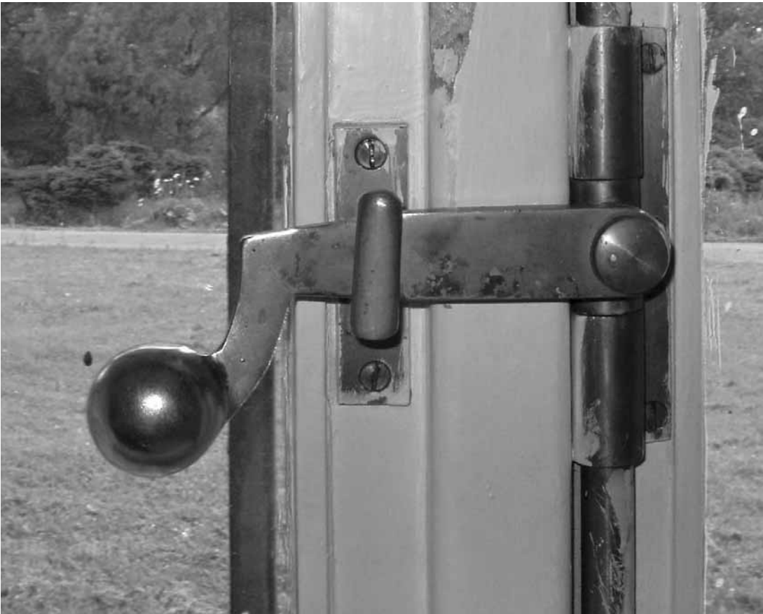
Zotavovňa Morava, detail otváracieho mechanizmu okennej výplne v parteri južnej fasády ubytovacieho krídla

Morava convalescent home, detail of the opening mechanism of the window on the first floor of the southern facade of the accommodation quarters