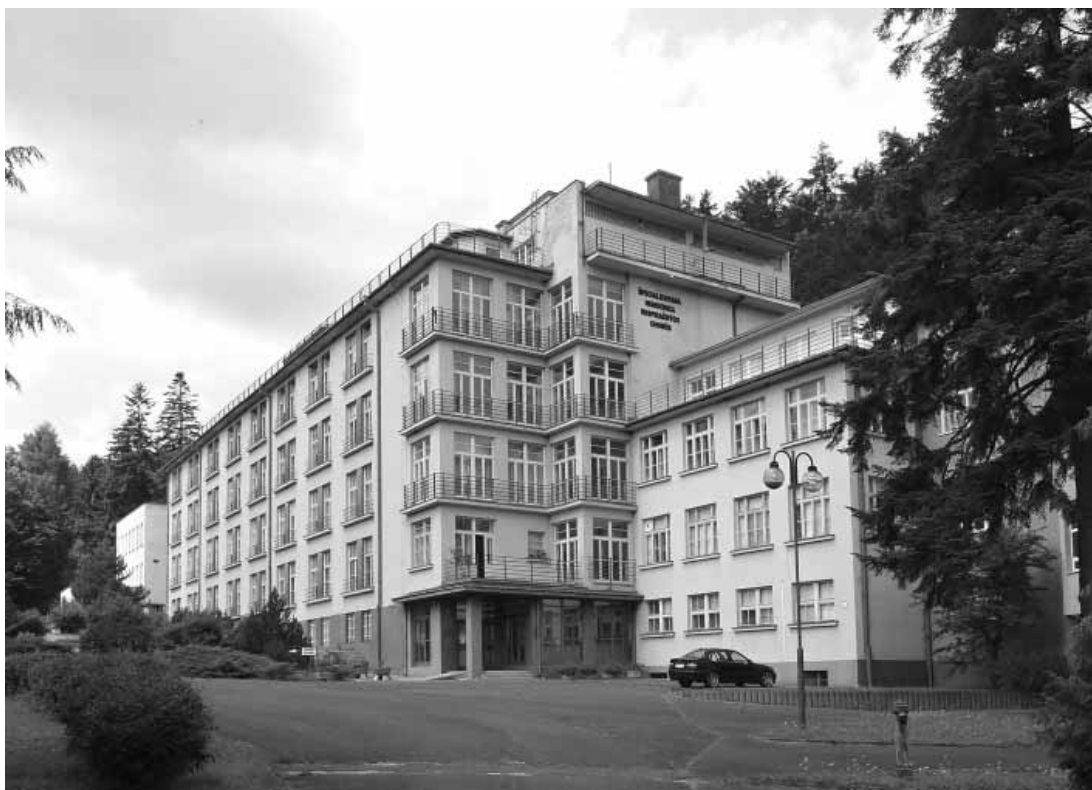
Kvetnica, pohľad na sanatórium z hlavnej prístupovej cesty