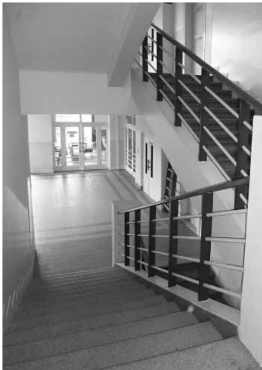
Kvetnica, pohľad z medzipodesty hlavného schodiska sanatória

je znížené, na západnej strane vzhľadom na stúpajúci terén prechádza do suterénu. Konštrukčne aj dispozične je riešené ako dvojtrakt, ktorý je v strednej časti na zadnej severnej strane rozšírený na trojtrakt. Do tohto rozšírenia chodieb na každom podlaží architekt umiestnil ordinácie a spoločné hygienické zariadenia. Južne orientované izby s kapacitou 96 lôžok sú radené pozdĺž dlhšej chodby, ktorá je osvetlená nielen presklenou stenou v ukončení, ale aj štedro dosvetlená radom okenných otvorov na severnej, k lesu orientovanej fasáde. Okná sú umiestnené vysoko pod stropom nad súvislou líniou pôvodných kovových skriniek, ktoré boli navrhnuté k jednotlivým izbám vzhľadom na mimoriadne prísne hygienické požiadavky súvisiace s vysokou infekčnosťou ochorenia TBC. Z týchto dôvodov sa súčasťou moderného vybavenia stal aj osobitný výťah na špinavú bielizeň a výťah pre spútkovy. Plošne