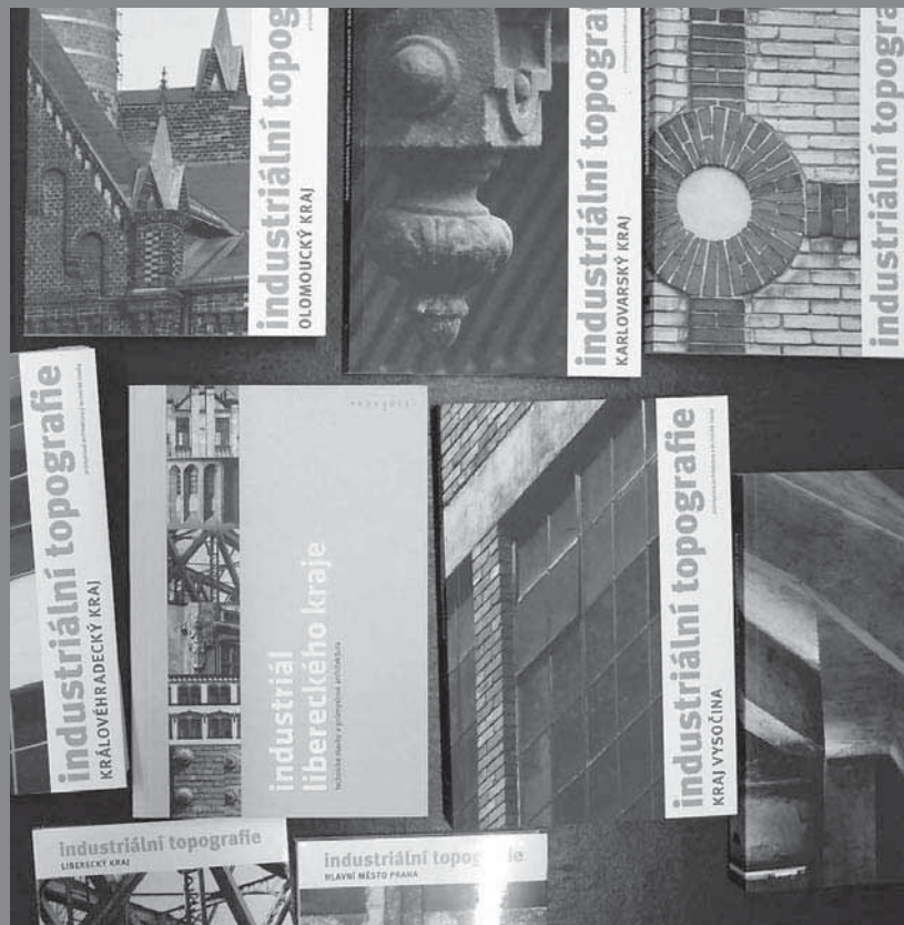
Séria publikácií Industriální topografie z produkcie Výzkumného centra průmyslového dědictví při FA ČVUT v Prahe

BERAN, Lukáš – VALCHÁŘOVÁ, Vladislava – ZIKMUND, Jan et al.: Industriální topografie. Kraj Vysočina. Praha, ČVUT, VCPD FA 2014. 274 s. ISBN 978-80-01-05544-1