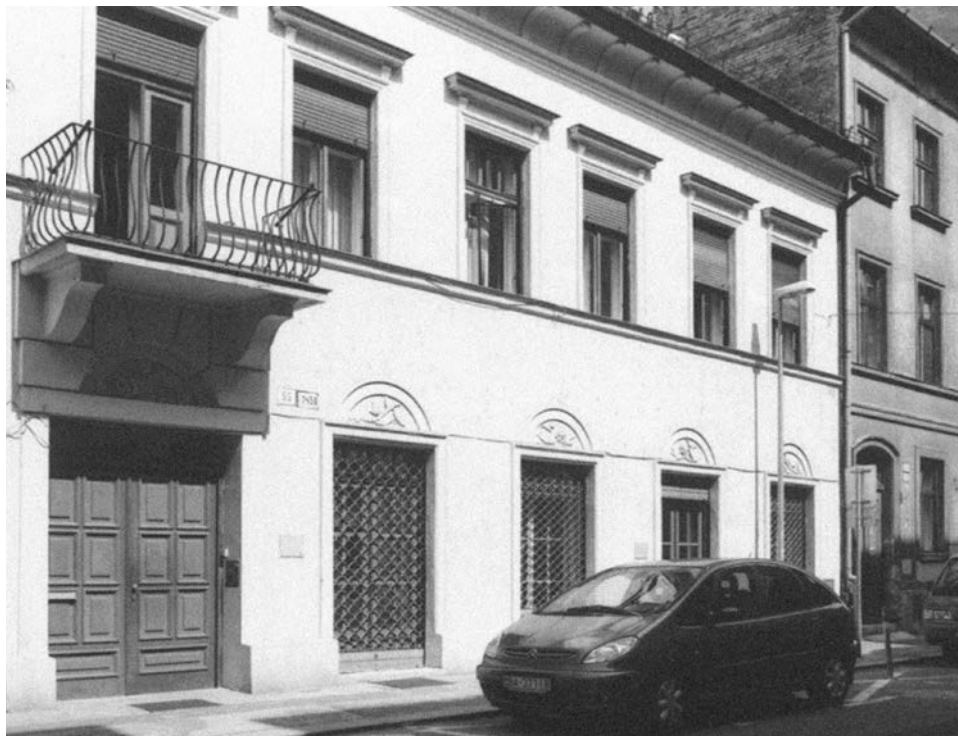
DOM SAMUELA STERNA, GRÖSSLINGOVÁ 55, BRATISLAVA, 1923

SAMUEL STERN HOUSE, GRÖSSLINGOVÁ ULICA 55, BRATISLAVA, 1923