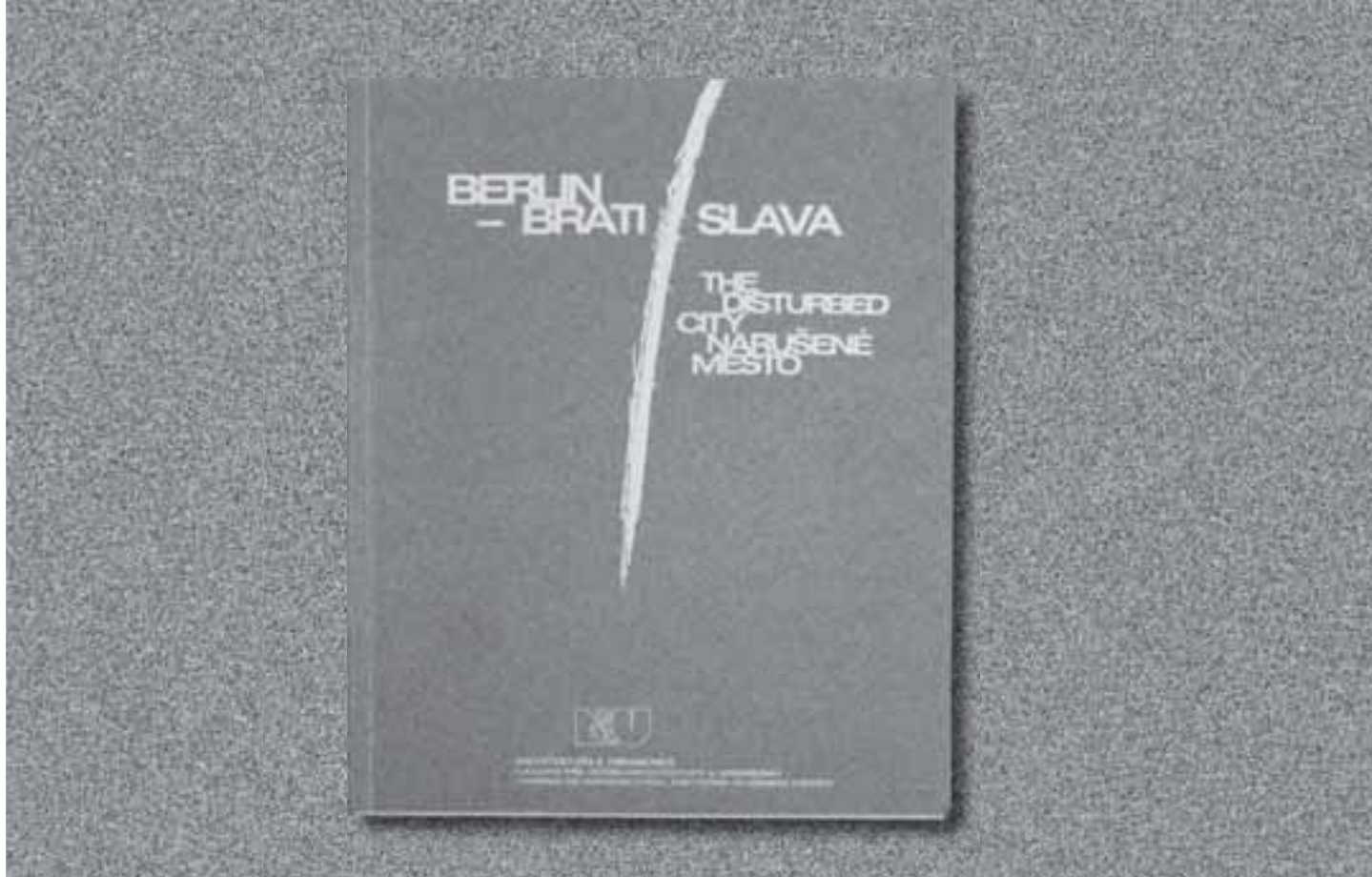
OBÁLKA ČASOPISU ARCHITEKTÚRA & URBANIZMUS ČÍSLO 1 – 2 Z ROKU 1994 VENOVANÉHO MEDZINÁRODNÉMU SYMPOZIU NARUŠENÉ MESTO BERLÍN – BRATISLAVA

COVER OF THE JOURNAL ARCHITEKTÚRA & URBANIZMUS NO. 1 – 2 / 1994 DEDICATED TO THE INTERNATIONAL SYMPOSIUM THE DISTURBED CITY BERLIN – BRATISLAVA